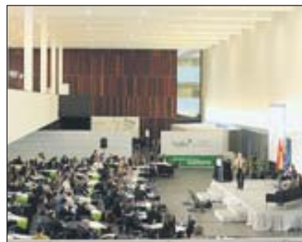
Aspecto general de la sala de Agora Talentia.

Este congreso ha supuesto que cuatro empresas de OPC Navarra hayan organizado y sido proveedoras, alineándose con la idea base del congreso: talento para colaborar y ofrecer lo mejor de cada empresa.