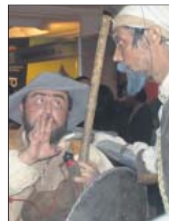
Animación de actores en el hotel.

pecializada en espectáculos al aire libre, contó su experiencia en eventos como el Fórum de Barcelona, la Expo de Zaragoza o la conmemoración del 2 de Mayo en Madrid. En su opinión, la clave de un espectáculo de este tipo es saber contar una historia, "y huir del espectáculo sólo hecho de pirotecnia de luz y sonido" al que se recurre muchas veces. Sus proyectos siempre incluyen un apoyo de las artes escénicas (danza, teatro, etc), nunca duran más de 40 minutos y se celebran por la noche. La mayor dificultad de su trabajo radica en saber qué quiere o necesita el cliente, para poder adaptarlo a un espectáculo dirigido a un determinado tipo de público.