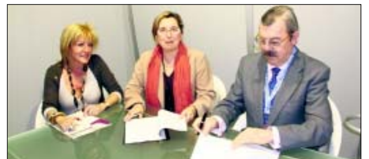
El convenio se firmó durante la celebración de la pasada edición de Fitur.

Por medio de este convenio, OPC Andalucía se compromete a que durante la celebración de los diferentes eventos que organice, la marca "RENFE" ocupará un lugar destacado, relevante y visible en todos aquellos soportes publicitarios que se utilicen. Por su parte, RENFE-AVE ofrecerá un descuento en todos los trenes de viajeros de Alta Velocidad-Larga Distancia, Alta Velocidad-Media Distancia y Cercanías-Media Distancia Convencional del 30% sobre el precio de la tarifa general vigente en cada momento y en los eventos que los miembros de la asociación organicen.