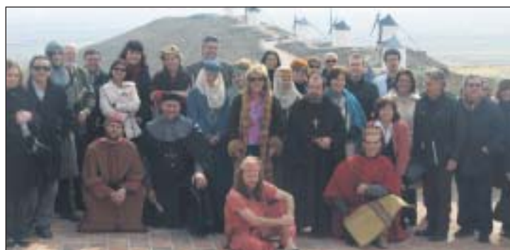
La Reunión concluyó con una visita a la localidad de Consuegra, de rico patrimonio.

En España hay 55 recintos feriales actualmente, que mueven un volumen de negocio de 700 millones de euros. Según los datos ofrecidos por el presidente de MSB Events, la ciudad en la que se celebra una feria recibe 12 euros por cada euro que se invierte en ella.