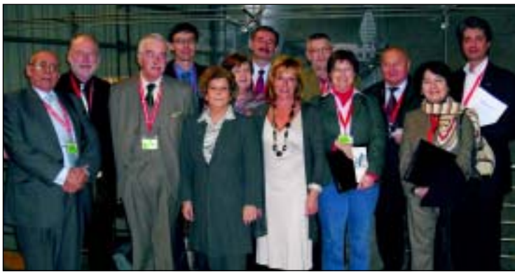
Los miembros de la Asamblea General de EFAPCO, celebrada en Lisboa, Portugal.

- "Antes de nuestro 4º Congreso, que tendrá lugar en Bruselas en Enero de 2010, espero que hayamos incrementado el número de miembros de pleno derecho hasta conseguir, al menos, 12 países participantes. De hecho -agregó Le Brun- la mayoría de nuestros actuales 10 miembros están en conversación con los líderes de OPC de los países no miembros de EFAPCO, animándoles a formar sus propias Asociaciones Nacionales y, al mismo tiempo, unirse a EFAPCO.