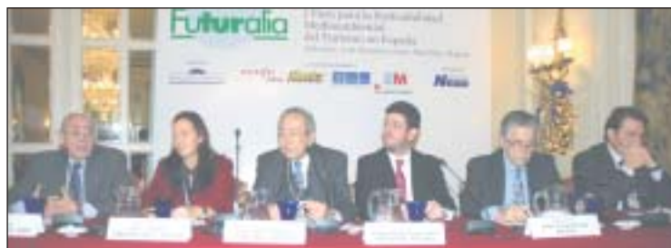
Algunos de los participantes de la primera edición de Futuralia.

guel Sebastián. A él asistieron más de 200 personas pertenecientes a distintos segmentos de la industria turística española. El objetivo de este foro es prever escenarios, definir propuestas en pro del desarrollo sostenible en el turismo en España, poner en valor el medio ambiente como un atributo vital para la preservación del entorno en la oferta turística española y sensibilizar a los empresarios del sector.