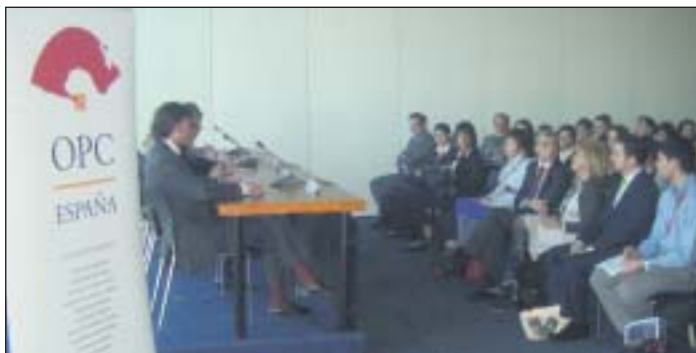
La Jornada organizada por la Federación en Fitur reunió a numerosas personas.