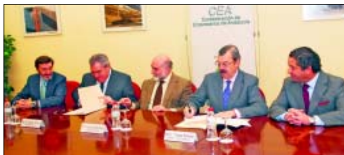
OPC Andalucía firma el convenio con la Asociación de Agencias de Viajes.

Este acuerdo viene a potenciar un segmento turístico, considerado por la Consejería de Turismo, Comercio y Deporte de la Junta de Andalucía, como prioritario en nuestro territorio, en cuanto rompe la estacionalidad y capta a un visitante de alto poder adquisitivo.