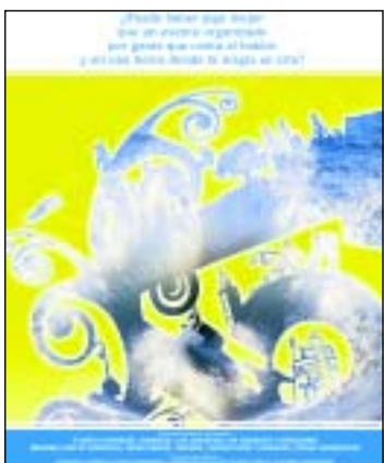
Imagen promocional de la campaña.

La campaña, que se prolongará durante varios meses, está enfocada fundamentalmente a las revistas especializadas del sector y a medios de información general.