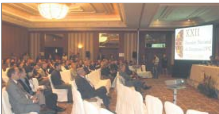
La sala de conferencias del Hotel Hilton Buenvista Toledo registró numeroso público.

Respecto a la crisis económica y su reflejo en la llegada de visitantes internacionales a nuestro país, el representante de la OMT ha señalado que las previsiones para este año apuntan a un crecimiento cero ó, en todo caso, a un descenso del 2% respecto al pasado año. En 2008 llegaron a nuestro país 924 millones de visitantes, un 2% más que el año anterior.