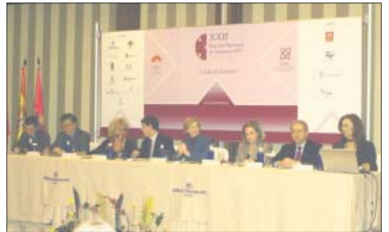
Las autoridades locales y regionales, durante la inauguración de la Reunión.