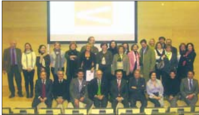
Los participantes en la XI Reunión Ibérica de OPC, celebrada en Girona.

no de reuniones. Organizado por la Asociación Catalana de OPC y el Girona Convention Bureau con el apoyo de la Cámara de Comercio de Girona, el encuentro incluyó la visita a distintos enclaves, representativos del territorio en el que se asientan y muy relacionados con el turismo de eventos.