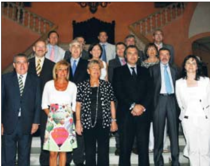
Los presidentes de OPC España y FEAAV junto con otros participantes en la firma.

Con este acuerdo, se establece una línea permanente de comunicación entre las dos federaciones, para evitar o solucionar cualquier posible conflicto que surgiera entre los asociados de los dos organismos en el desarrollo profesional de sus actividades.