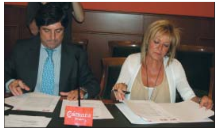
El presidente de AFE y la presidenta de OPC España, firmando el acuerdo.