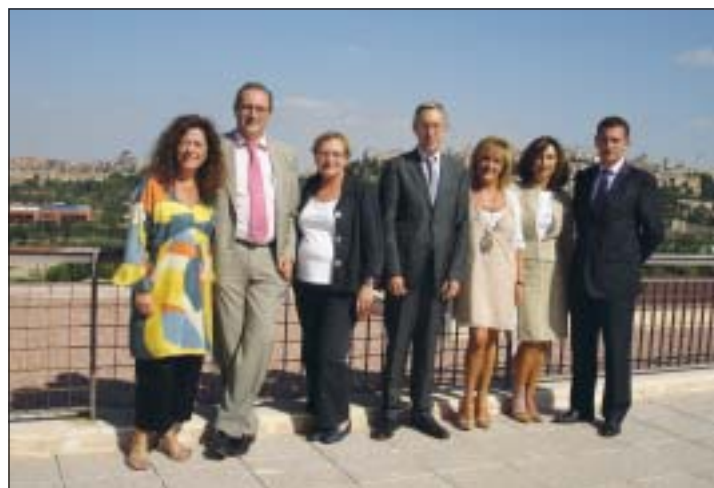
La presidenta de OPC España junto a los participantes en la jornada.