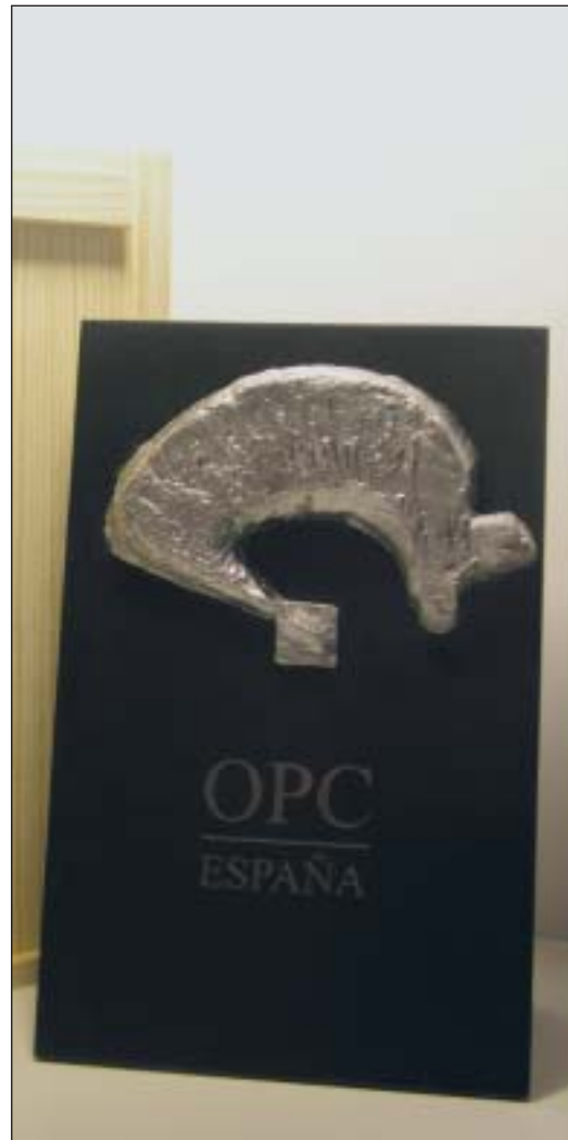
La pieza 'Territorio OPC', obra del artista Miguel Couto.

La Federación ha lanzado una serie limitada de cincuenta piezas de la escultura que también recibirán las instituciones que colaboran con los organizadores profesionales de congresos.