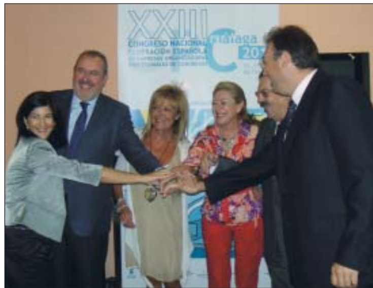
Al acto de presentación acudieron los responsables de las entidades organizadoras.

El evento cuenta con el respaldo de todas las instituciones públicas y empresas del ámbito del turismo. Toda la información del congreso se puede consultar en www.opcmalaga2010.com .