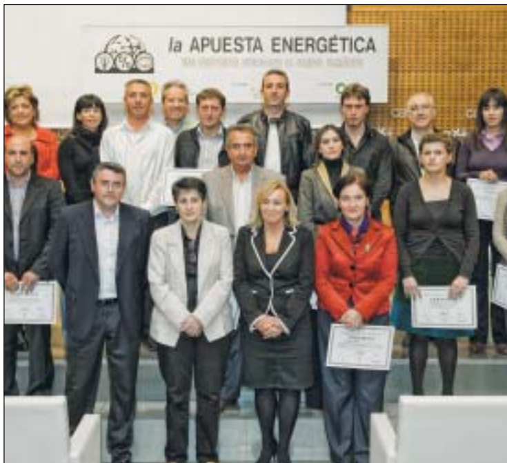
La consejera junto con representantes de las entidades de 'La Apuesta Energética'.

Dentro del programa de este año han sido distinguidas como mejores apuestas cumplidas la de la Asociación de Diabéticos de Navarra (ADINA), el ayuntamiento de Ansoáin y el Instituto de Educación Secundaria (IES) Sierra de Leire de Lumbier.