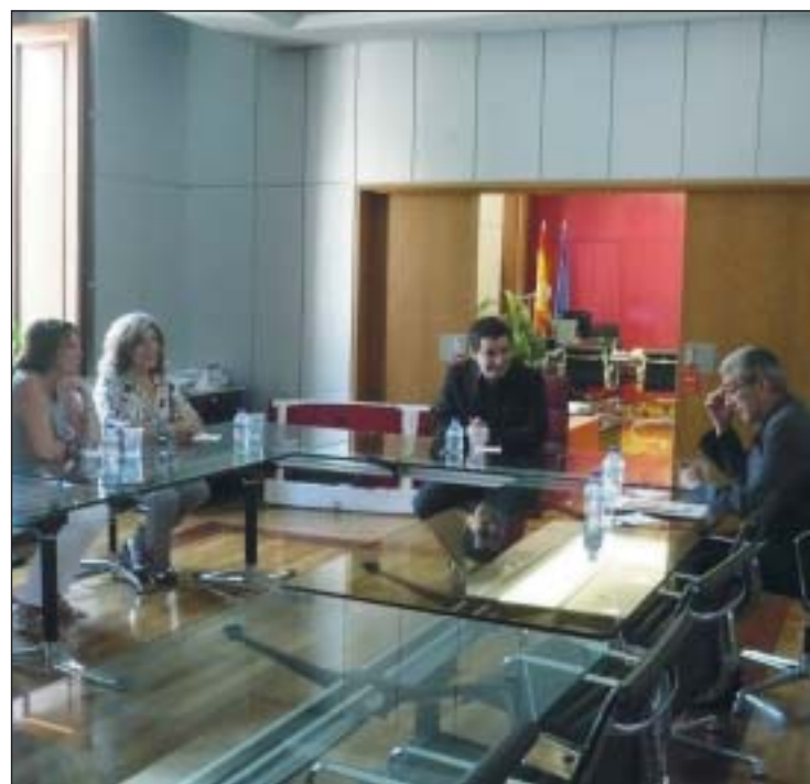
Los responsables de la Asociación OPC Región de Murcia junto al consejero.

La Asociación está integrada por Alquibla Congresos, Agora Gabinete de Comunicaciones y CEDES. Además, cuenta con la colaboración de la empresa pública Murcia Cultural y del Auditorio y Centro de Congresos de Murcia.