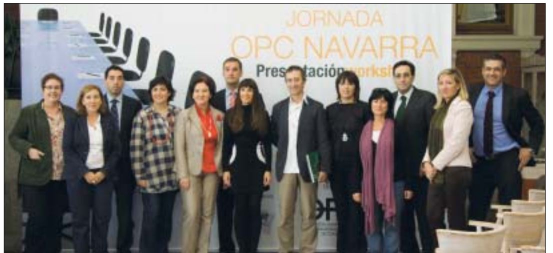
Algunos de los participantes en la jornada organizada por la Asociación OPC Navarra.