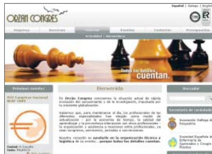
Orzán Congres ya utiliza la marca de AENOR en su página de Internet.

La calidad en los procesos y la orientación al cliente de Orzán Congres y de Viajes Orzán ahora están certificadas oficialmente.