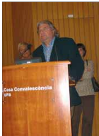
Intervención del presidente de OPC Cataluña.