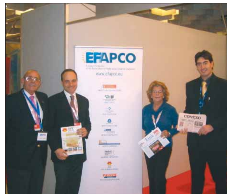
Presencia de OPC España y EFAPCO en la BTC.

Diversos miembros de OPC España asistieron como compradores invitados a esta importante feria del mercado de reuniones y congresos.