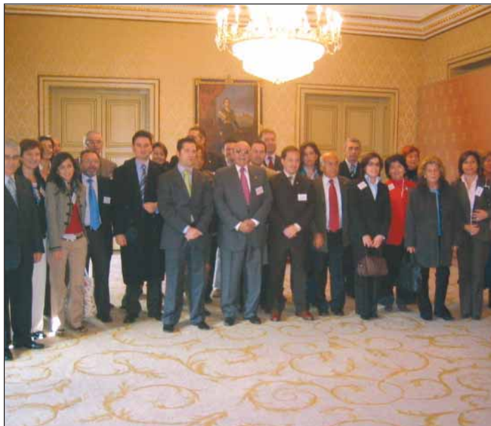
En la visita al Ayuntamiento se hizo entrega de un logotipo en bronce de la Federación.

Asistieron prácticamente todos los miembros de la Junta Directiva de ambas organizaciones profesionales (OPC Portugal y OPC España) y se decidió que las próximas ediciones tengan lugar en Évora el 2007 y en Toledo el 2008.