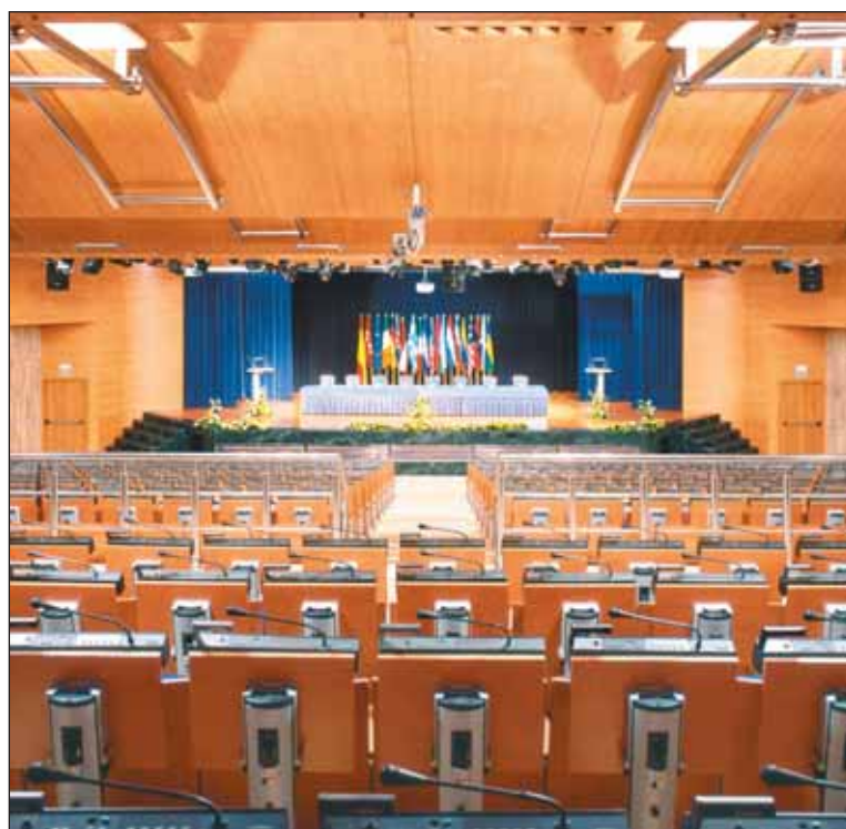
El Hotel Meliá Castilla será la sede de esta XX Reunión. En la imagen, su auditorio.

El conjunto del programa puede conocerse en detalle a través de la página web de Internet www.opcspain.org . Para más detalles, puede también contactarse con la empresa OPC designada para la organización operativa de la Reunión: Siasa Congresos ( www.siasa.es ).