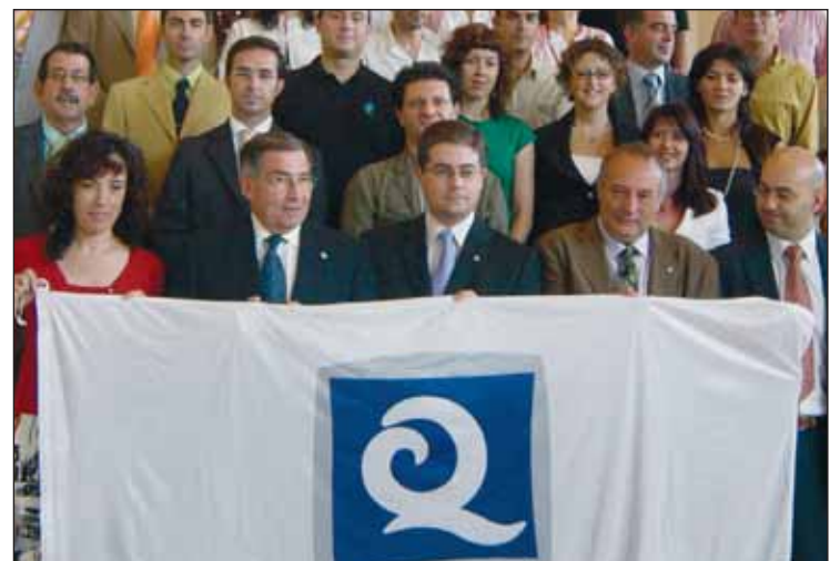
Responsables y personal del Auditorio con la Q Turística.

nos turísticos reconocidos con el distintivo de Compromiso Turístico (SICTED): Cartagena, Lorca y Archena, y otros cuatro destinos que están trabajando para conseguir este distintivo: Sierra Espuña, Valle de Ricote, Noroeste y Murcia. Es clara la apuesta de las entidades públicas y privadas de esta Región por convertirse en un 'Destino de Calidad'. A nivel nacional hay un total de 1.883 establecimientos certificados con la Q de Calidad Turística, de los cuales 81 pertenecen a la Región de Murcia, lo que la sitúa en décima posición a nivel nacional.