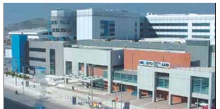
El edificio Helexpo Palace en el que se celebrará el encuentro europeo.

EFAPCO www.efapco.eu o contactar con la oficina operativa de EFAPCO en Madrid, en el teléfono 91 552 7745.