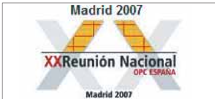
Esta será la vigésima edición de la Reunión Nacional de OPC España.