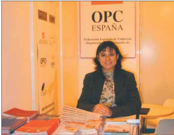
OPC España en la pasada edición de la Feria Internacional de Turismo FITUR.

EITBM, que celebra este año su tercera edición en Barcelona, reúne unos 3.000 proveedores internacionales de más de 75 países y espera recibir alrededor de 6.000 visitantes.