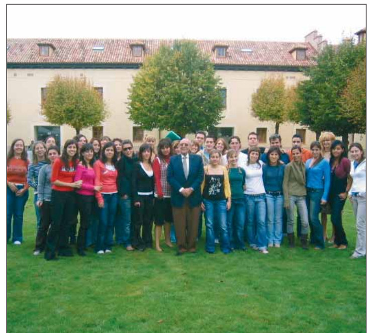
Los alumnos de Turismo de la UCM en el CES Felipe II de Aranjuez.

Además de las clases teóricas, la asignatura incluye las visitas técnicas a centros de congresos, convenciones y hoteles que sirven de sede a eventos. Entre el temario se abordan todas y cada una de las facetas que se engloba la organización de congresos y reuniones.