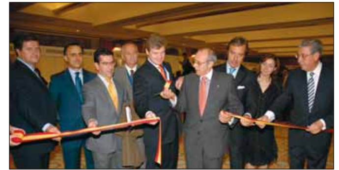
Momento de la inauguración del IV Salón NexoBusiness 2006.

El encuentro sirvió para múltiples contactos comerciales de final de temporada turística y para conocer diversas novedades y mejoras en el servicio de varios proveedores laborales.