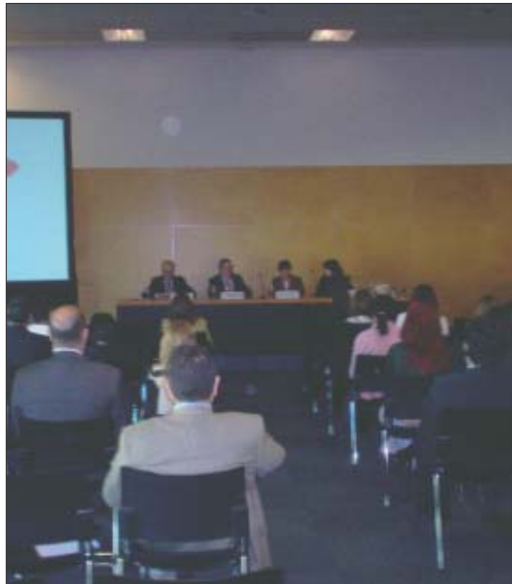
La contratación de productos procedentes del comercio justo fue uno de los temas tratados.

La Jefa de Recursos Ambientales de la Expo Zaragoza, relató las medidas que la EXPO está tomando para la realización de esta importante exposición con el mayor respeto a la sostenibilidad, medio ambiente y productos con etiqueta ecológica.