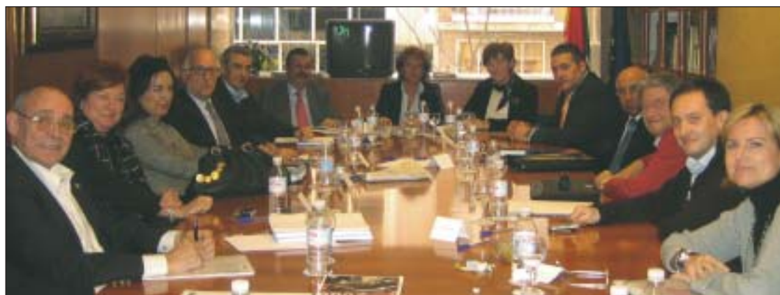
Los miembros de la Junta Directiva de la Federación OPC España durante su reunión celebrada en Madrid.