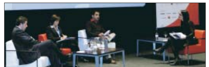
La mesa sobre la comunicación en los eventos fue muy participativa.

La conveniencia de que los OPC den servicios de comunicación a sus clientes, o si este tipo de funciones se deben externalizar o deben partir de personal propio de la empresa fueron algunas de las ideas debatidas en esta sesión. En ella se vió cómo la organización de eventos "especiales" puede aportar valor añadido al servicio que se ofrece a las empresas y se apuntó la idea de que, bien se llamen agencias de comunicación, de eventos o de organización, el trabajo que se contrate sea lo más profesional posible.