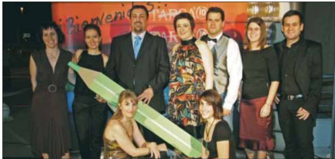
El color fue el tema central de la fiesta del décimo aniversario de la empresa TARSA.