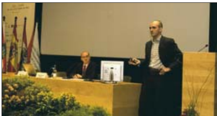
Cerezales se apoyó en un estudio que está realizando sobre el Sector.

Para el experto en congresos internacionales, se da una tendencia a que los congresos en España se celebren cada vez más en ciudades de tamaño medio para huir, en parte, de las tarifas de los destinos como Madrid y Barcelona. En su opinión, la decisión de ir a uno u otro destino se basa, en muchas ocasiones, en que la ciudad tenga una nueva motivación como puede ser, por ejemplo, el contar con un nuevo palacio. El ser una ciudad "sostenible" y especializarse en congresos respetuosos con el medio ambiente, ha indicado, sirve para atraer a las asociaciones y clientes a la hora de realizar un congreso.