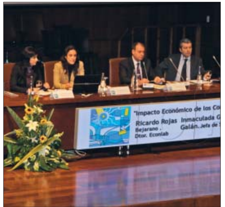
Los participantes en la mesa redonda sobre el impacto económico de los congresos.

Y concluyó diciendo que "el sentido aproximado de lo esencial es más importante que el cálculo precio de lo irrelevante".