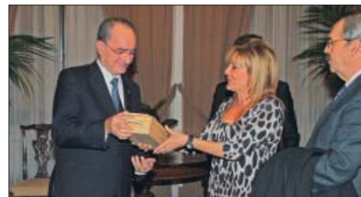
El alcalde de Málaga recibe a la presidenta de OPC España y al de OPC Andalucía.

La ciudad de Ronda fue el destino de la excursión del último día en donde los visitantes comprobaron la oferta del lugar bajo la campaña "Ronda, alma de Andalucía". El circuito de automovilismo Ascari, fue el escenario de despedida de los participantes.