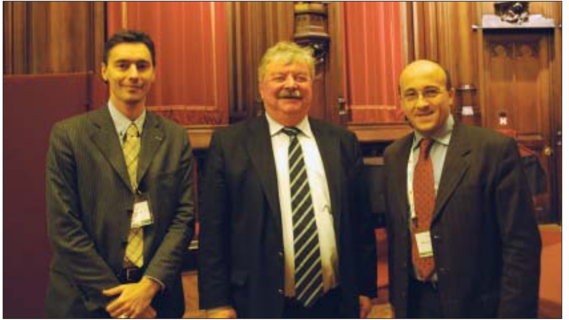
Algunos de los participantes en el congreso de la Federación Europea de OPC, celebrado en Bruselas.