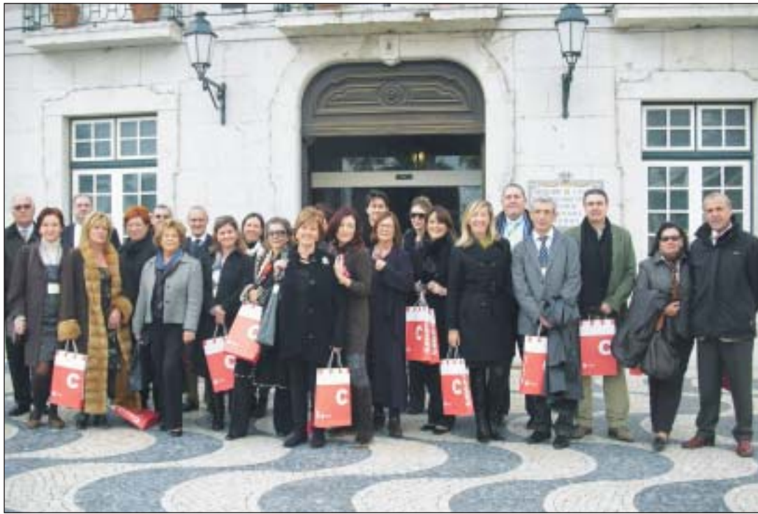
Los participantes en la XII Reunión Ibérica de Empresas OPC, que se celebró en Estoril (Portugal) en diciembre de 2009.

El encuentro también sirvió para que los participantes conocieran la costa de Estoril, Sintra y Cascais como sede de reuniones internacionales.