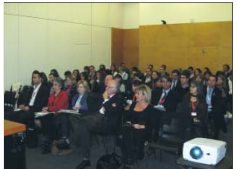
La mesa congregó a numerosos participantes entre profesionales y estudiantes.