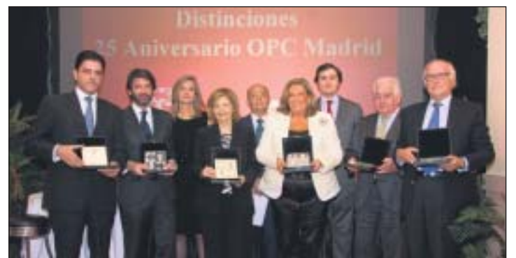
Las distinciones que entregó OPC Madrid en la celebración de su 25 Aniversario.

La Asociación aborda este 2011 con los firmes objetivos de enfatizar el protagonismo de las empresas colaboradoras, las cuales hacen posible "la excelencia profesional de OPC Madrid".