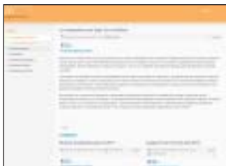
El blog creado por Congresos Navarra.

El blog ofrece, también, una relación de enlaces de interés relativos al sector congresual y al empresarial. Por otro lado, los internautas encontrarán un apartado "restringido", dirigido al personal de la empresa, que hace alusión a formación interna y a documentos multimedia de Congresos Navarra.