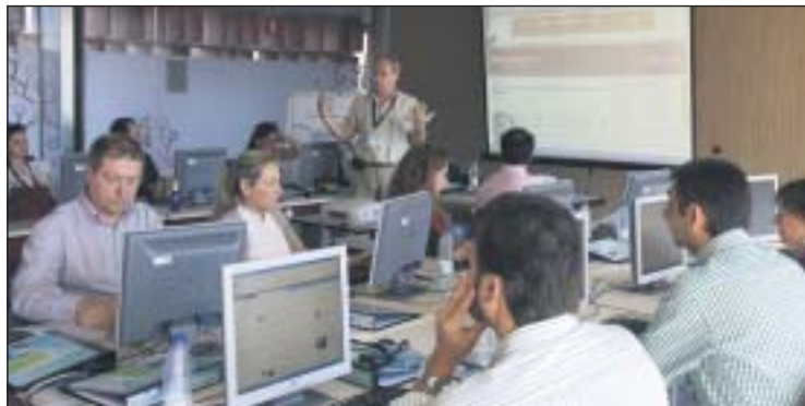
Un curso formativo para los profesionales de congresos de Castilla-La Mancha.

Para este nuevo año, se han recibido sugerencias para la impartición de más de treinta cursos "a la carta" en los que cabe destacar los de: "Buenas maneras y etiqueta social para directivos", "Seguridad integral durante eventos", "Prevención médico-sanitaria en eventos" y "Responsabilidad civil durante un evento" que destacamos entre más de una treintena de cursos elegidos por los destinatarios de la formación, mediante contactos y encuestas directas.