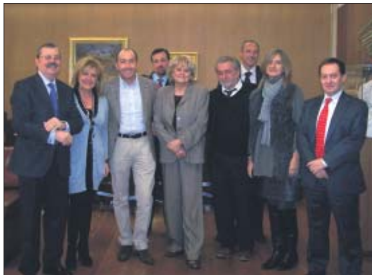
El alcalde de Elche y la concejala de Turismo recibieron a la junta directiva de OPC España.