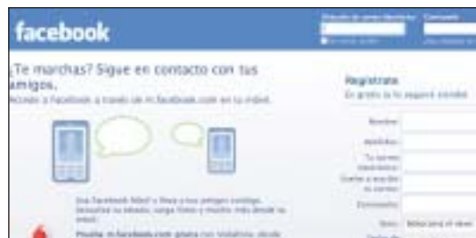
OPC Navarra ha creado un perfil en la red social Facebook.

OPC Navarra está presente en las redes sociales, mediante la creación de un perfil en Facebook, con el fin de "poder estar en contacto con las empresas miembros, otros colaboradores y las asociaciones del sector, así como observar las tendencias y uso de las redes sociales por parte del público". Esta iniciativa de OPC Navarra, se ha puesto en marcha como plataforma que refuerce, difunda y consolide sus acciones e interactuar a través de este medio, en pleno auge.