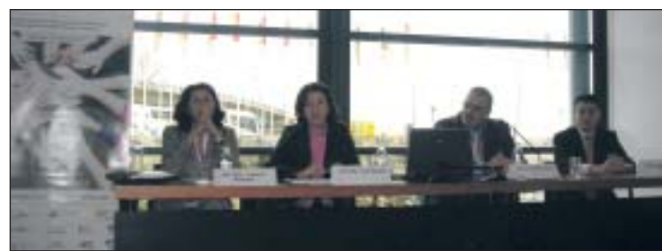
Mesa redonda organizada por OPC España en el marco de la celebración de Fitur.

Las preguntas del público incidieron en la seguridad y la privacidad de los datos transmitidos a través de estos sistemas y acerca de las "amenazas" que para los congresos presenciales pueden tener las nuevas tecnologías.