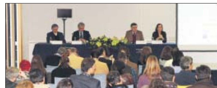
Celebración del Congreso de APECATE en el Centro de Congresos de Estoril.

El comité de APECATE resaltó, al cierre del encuentro, la satisfacción por el elevado nivel de las ponencias, resaltando las ideas aportadas para "enfrentarse" a los desafíos que lleva aparejados la internacionalización.