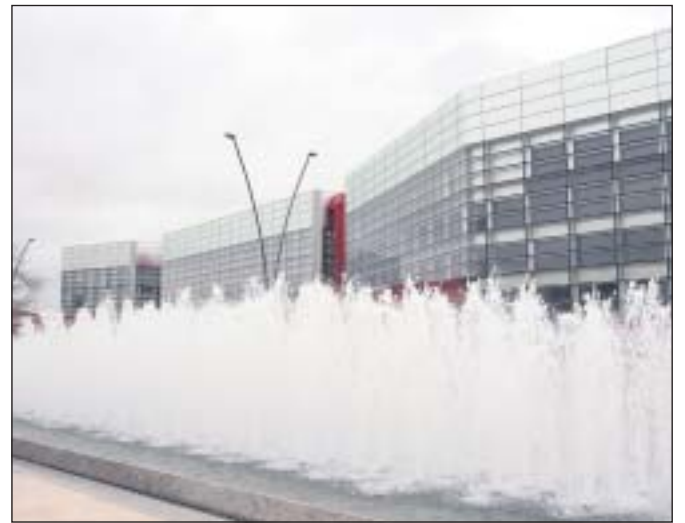
El Museo de la Evolución Humana de Burgos, uno de sus atractivos turísticos.

potenciarlo". Entre los objetivos planteados, destaca la promoción de Burgos como destino MICE, la coordinación de visitas de prospección de los organizadores de congresos a la ciudad; la unificación de la oferta de todas las empresas implicadas en la organización de un evento y la elaboración de presentación de candidaturas para la elaboración de congresos.