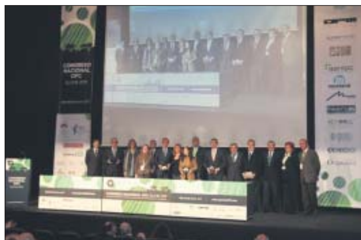
Todos los galardonados por la Federación OPC España en su Congreso de Elche.

También han sido merecedores de premios la empresa de servicios complementarios Econlab y a la publicación especializada Professional Events.