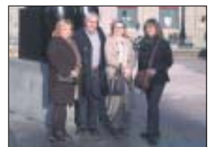
Miembros de OPC Asturias.

La asociación de Empresas de Organización Profesional de Congresos del Principado de Asturias, creada en el año 2009, ha iniciado el nuevo año con datos muy positivos. En estos últimos meses, además de contactar con diversos organismos oficiales del Principado de Asturias, tales como Club de Empresas de Oviedo, Club de Empresas de Turismo de Negocios, Sociedad Regional de Turismo o Gijón Turismo, entre otras, la asociación ha comenzado con éxito la captación de nuevos socios. Fruto de este trabajo, en la actualidad, cuenta con seis empresas OPC asociadas, a lo que hay que sumar cuatro empresas colaboradoras. "Nuestra intención es seguir creciendo, por lo que seguiremos con nuestra labor, invitando a unirse a nosotros a aquellas empresas relacionadas con el sector del turismo de negocios", señalan desde la presidencia de la asociación asturiana.