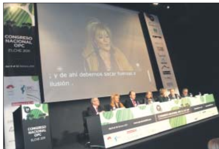
El alcalde de Elche y la presidenta de OPC España, entre otros, en la apertura del congreso.

Previo a la entrega de los Premios OPC, la Ley Omnibus centró todo