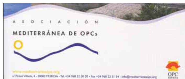
El folleto-guía de OPC Mediterránea pretende ser su carta de presentación.

La Asociación Mediterránea cuenta con dos nuevos socios: IDEX, Ideas y Expansión de Alicante y TOT NOU de Valencia. Por otra parte, como empresas colaboradoras se han incorporado los Palacios de Congresos de Castellón y Peñíscola y AM-MEDIOS, empresa de audiovisuales de Murcia.