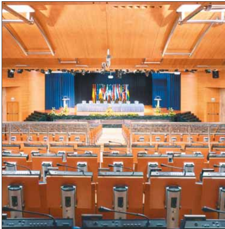
El auditorio del Hotel Meliá Castilla acogerá la XX Reunión Nacional de OPC.

El programa de la XX Reunión Nacional de OPC España dará cabida a los más destacados representantes de los distintos ámbitos de la organización de congresos y reuniones, con el fin de analizar a fondo las tendencias y novedades del sector y compartir técnicas y experiencias. La sede de las sesiones será el auditorio del madrileño Hotel Meliá Castilla y, paralelamente a las ponencias, se desarrollará una exposición de productos, servicios y destinos de reuniones.