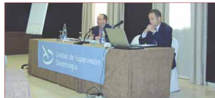
En las sesiones se abordó la aplicación de las normas de autorregulación.

El próximo seminario tendrá lugar en Barcelona, en el mes de noviembre.