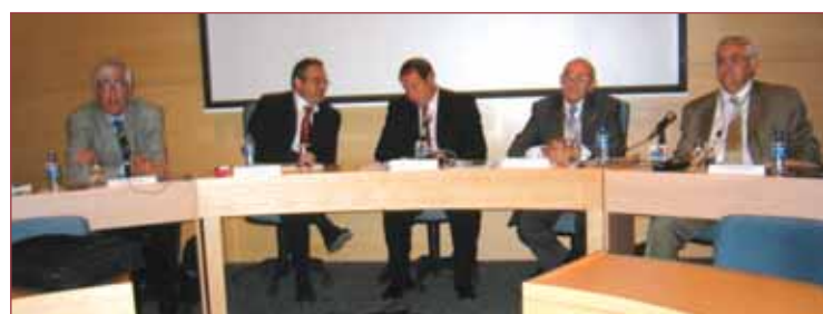
En las sesiones se abordó la aplicación de las normas de autorregulación.

El congreso reunió a más de 400 profesionales del Turismo de Iberoamérica y a un número muy alto de profesionales españoles.