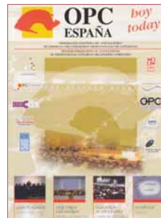
Portada de OPC Hoy.

De ocho páginas y a todo color, el documento detalla las actividades principales de la Federación, tales como la Reunión Nacional o la Reunión Ibérica y recoge algunas de las últimas noticias produ-