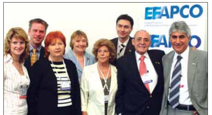
Los miembros de la Junta Directiva de EFAPCO, tras la reunión en IMEX.

La próxima reunión de la Junta Directiva tendrá lugar en Málaga el próximo mes de septiembre y la Asamblea General-Reunión Anual se realizará en Atenas, a principios de diciembre del presente año.