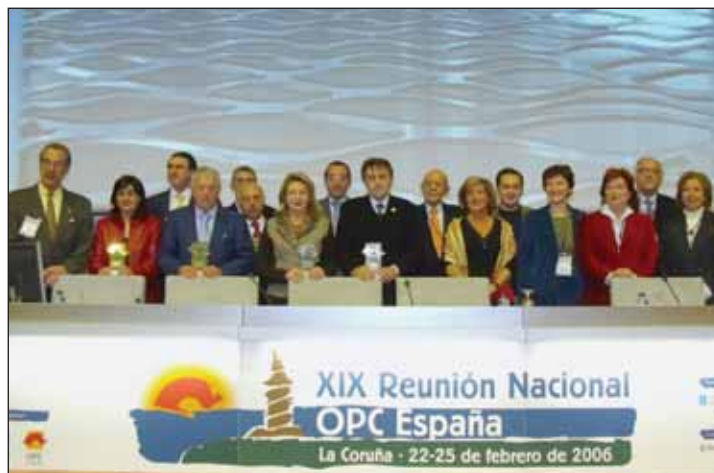
Los ganadores de los premios 2005 con los miembros de la junta directiva.

Por otra parte, la Federación Española de OPC convoca los Primeros Premios Periodísticos OPC, que tienen como objetivo premiar los trabajos de comunicación que traten sobre la labor de los Organizadores Profesionales de Congresos. Al premio pueden presentarse trabajos tanto escritos como audiovisuales, publicados o emitidos a lo largo del presente año. El primer premio está dotado con 5.000 € y habrá también un accésit de 1.000 €. Los originales deberán remitirse a las oficinas centrales de la Federación OPC España (Plaza Mariano de Cavia, 1, 1ª planta) antes del 31 de diciembre del presente año.