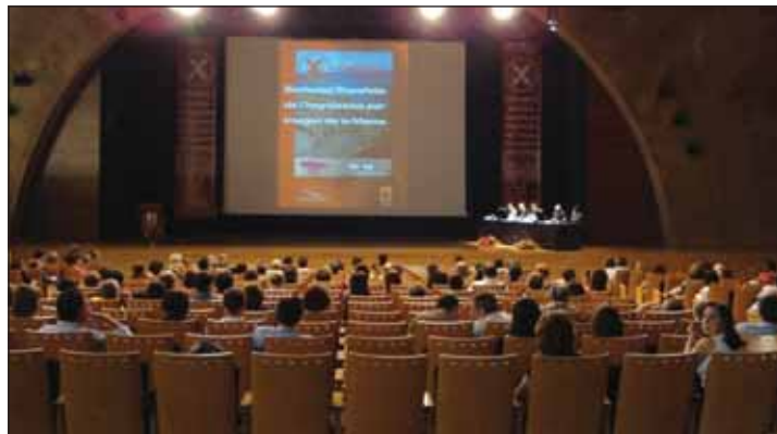
El Congreso de la SEDIM fue uno de los celebrados en el Palacio de Tarragona.

Durante el mes de junio se celebraron dos congresos más: el congreso de Medicina Tradicional China y el congreso de la SEMES, Sociedad Española de Medicina de Urgencias y Emergencias. Este último tuvo una participación de 1.000 personas. Además, durante los días 15, 16 y 17 de este mes se inauguró en el Recinto Ferial 'ECOTECA', la I Feria de Alimentación Ecológica de Cataluña.