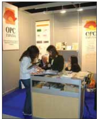
El stand repartió material promocional.

Los medios de comunicación del sector también estuvieron presentes en este salón y se aprovechó la presencia de las principales empresas de la industria turística para realizar entrevistas y recabar datos sobre la marcha del año en el mercado de reuniones.