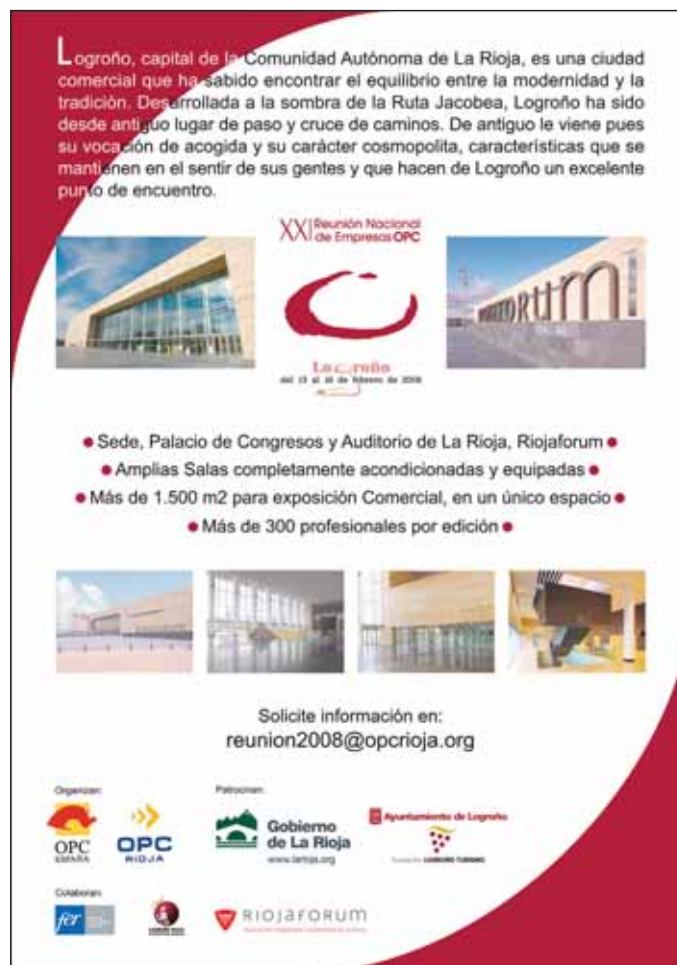
El folleto promocional de la XXI Reunión Nacional de OPC muestra los atractivos turísticos de la Rioja, así como el palacio de congresos de la capital.