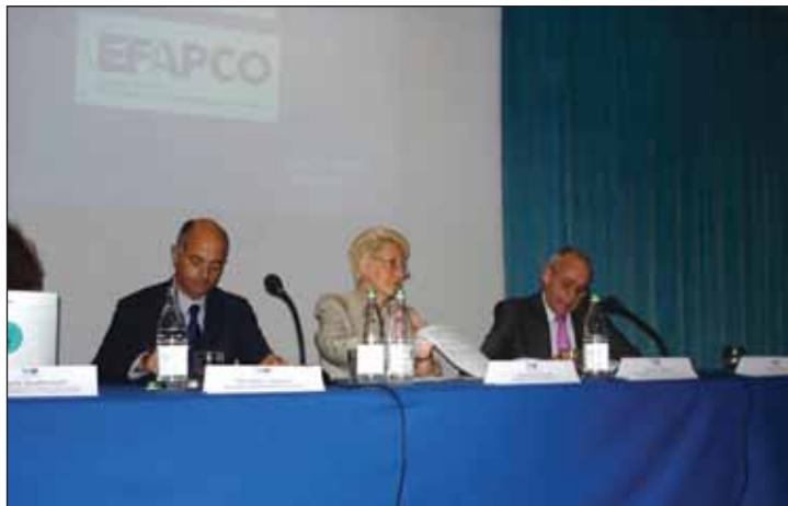
Presentación de OPC España y EFAPCO ante los profesionales de congresos de Italia.

Durante el coloquio se comentó la diferencia sustancial entre la capacidad de relación y negociación con los palacios de congresos que tenemos los OPC españoles en comparación con la que tienen, actualmente, los OPC italianos.