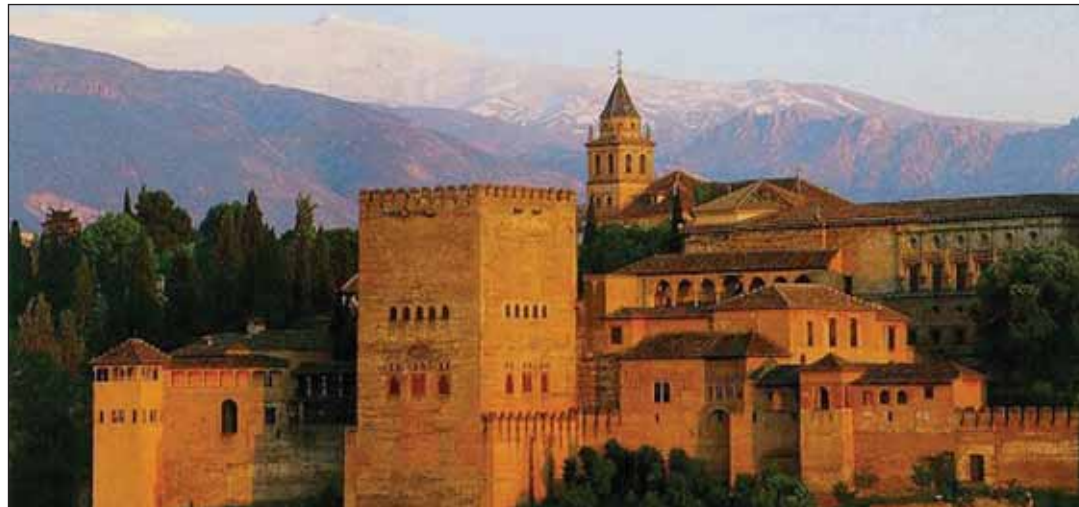
La indiscutible belleza de la Alhambra de Granada puede convertirla en una de las nuevas siete maravillas del mundo.