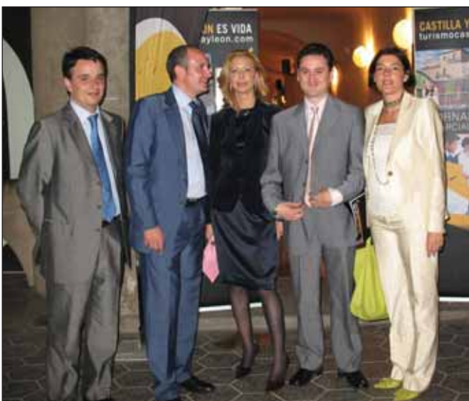
Momento de la clausura de la jornada que organizó Sotur en Barcelona.

La convocatoria resultó todo un éxito y sirvió como punto de encuentro de operadores turísticos de distintos segmentos: OPC, agencias de viajes, agencias de comunicación y eventos, centrales de reservas, turoperadores/mayoristas, y publicaciones, así como travel managers de empresas.