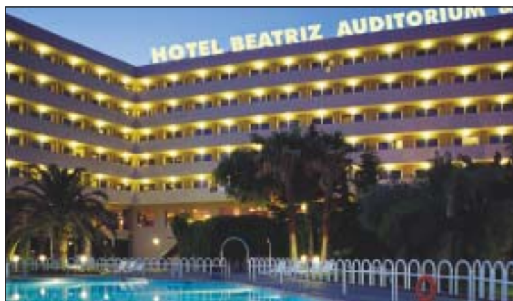
El Hotel Beatriz de Toledo será la sede de la XXII Reunión Nacional de OPC España.

Entre los muchos atractivos que se podrán conocer en el encuentro, se está barajando visitar la ciudad por la noche, con una visita privada al Museo de Santa Cruz; conocer el Toledo de las tres culturas visitando la catedral, la sinagoga y la mezquita; visitar un molino en funcionamiento o participar en una teatralización de la batalla de Consuegra.