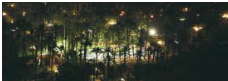
La ciudad de Elche, sede del congreso, cuenta con numerosas zonas verdes.

Elche (Alicante) es un enclave muy apropiado para llevar a estudio la temática de este congreso por la singularidad de la jardinería mediterránea. Elche cuenta con el palmeral más extenso de Europa, declarado Patrimonio de la Humanidad por la UNESCO en el año 2000, y con otros espacios naturales de relevancia como el Parque Natural del Hondo, el Clot de Galvany y como proyecto destacable el que próximamente será el Parque Periurbano de la Rápita (antiguo vertedero municipal de escombros).