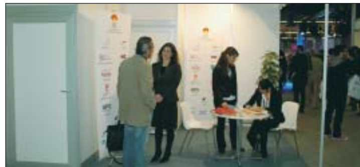
El stand de OPC España en Eventoferia atendió a numerosos profesionales.

La iniciativa, pese a ser la primera, tuvo gran acogida entre las empresas del sector, por lo que ya se está trabajando en la siguiente edición para el próximo año.