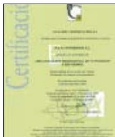
Certificado de calidad de PAP

La certificación renovada por E.C.A. CERT, abarca la "Organización Profesional de Congresos y Reuniones". El certificado emitido tendrá validez hasta Abril 2011. Esta empresa también es licenciataria de la marca 'Madrid Excelente', habiendo superado la auditoría para el uso de la misma hace unos meses.