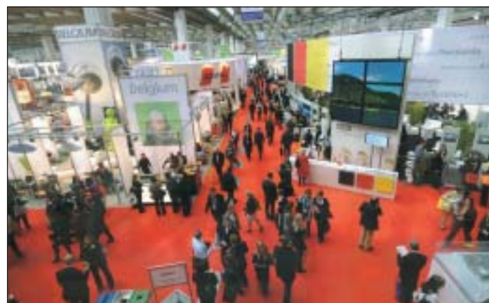
El stand de EFAPCO y OPC España recibió la visita de numerosos visitantes.

Es destacable el interés despertado por EFAPCO entre las diversas Asociaciones colaboradoras de IMEX, celebrándose varias reuniones con Asociaciones como IAPCO, MPI e ICCA.