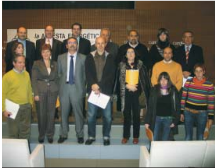
Las 13 nuevas empresas que han firmado su adhesión al Plan 'La Apuesta Energética'.

CO2 producidas por el transporte del evento. En caso de perder se compromete a realizar una campaña educativa sobre ahorro y eficiencia energética dirigida al personal de oficinas.