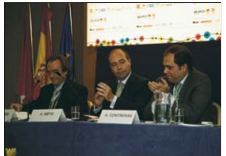
Congreum destina sus beneficios a la Fundación Síndrome Down en Madrid.

do el reciclaje, la eliminación y ahorro de consumo de papel, la optimización del gasto energético, el uso de energías alternativas, ahorro en el consumo de agua, la erradicación del turismo sexual, explotación infantil, publicidad engañosa y otras malas prácticas. Además busca potenciar la concienciación sobre el compromiso social de las empresas, el comercio justo, la eliminación de trabas y burocracia en la libre circulación de personas y la igualdad en la accesibilidad para personas con discapacidades físicas y sensoriales.