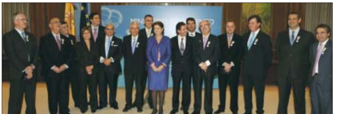
Los galardonados con la Medalla al Mérito del Transporte Terrestre, con la ministra de Fomento, Magdalena Álvarez.

otros cargos: presidente de la Asociación Provincial de Empresarios de Transporte Discrecional de La Coruña, presidente de la Asociación Gallega Anetra-Galicia, presidente de la Sección Discrecional del Comité Nacional de Transportes del Ministerio de Fomento, vocal del Consejo Nacional de Transportes (Órgano Superior de Asesoramiento, consulta y debate del Ministerio de Fomento), presidente de la Confederación de Transporte por Carretera, etc.