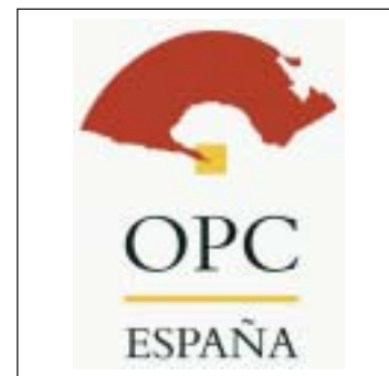
Nuevo logotipo de OPC España.

Calle Capitán Haya, 1, planta 15 Edificio Eurocentro 28007 Madrid Teléfono: 902 110 367