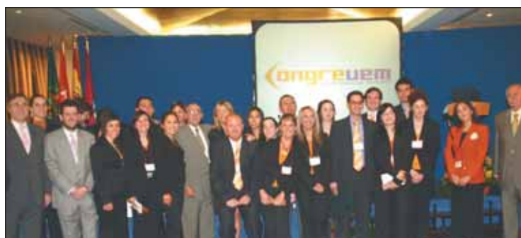
Los participantes en el I Encuentro Congreuem.