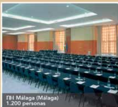
NH Málaga (Málaga) 1.200 personas