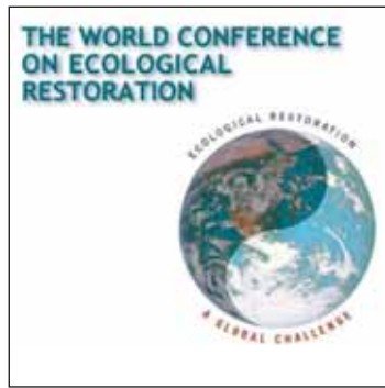
Logo del congreso de restauración ecológica.

Por su parte, el 4º Congreso Forestal Español, que se desarrollará entre los días 26 y 30