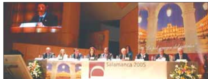
El Palacio de Exposiciones y Congresos de Castilla y León.