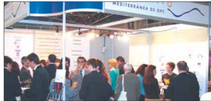
El stand de OPC Mediterránea repartió folletos y dio a conocer sus actividades.