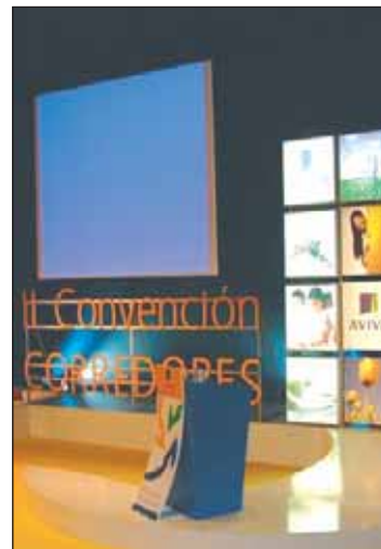
Satisfactorio primer año de Riojafórum.

De acuerdo a su tipología fueron 18 los congresos y convenciones, 20 las jornadas, 6 las ferias y exposiciones, 39 las reuniones y otros 25 los eventos de diversa naturaleza (galas, presentaciones de producto, etc.). El 10% fueron de carácter internacional, el 25% nacional y el 65% regional. La estancia media de los mismos fue de 2 días.