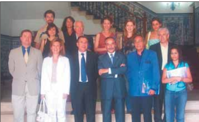
Miembros de OPC Madrid, en su visita a Talavera de la Reina.