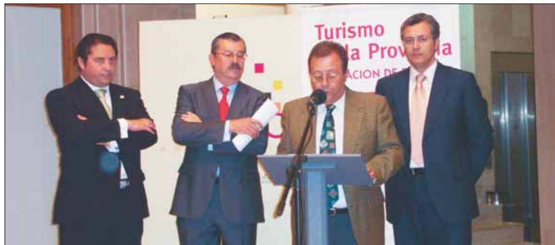
Momento de la presentación a las empresas turísticas de Sevilla.