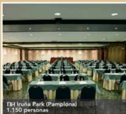
NH Iruña Park (Pamplona) 1.150 personas