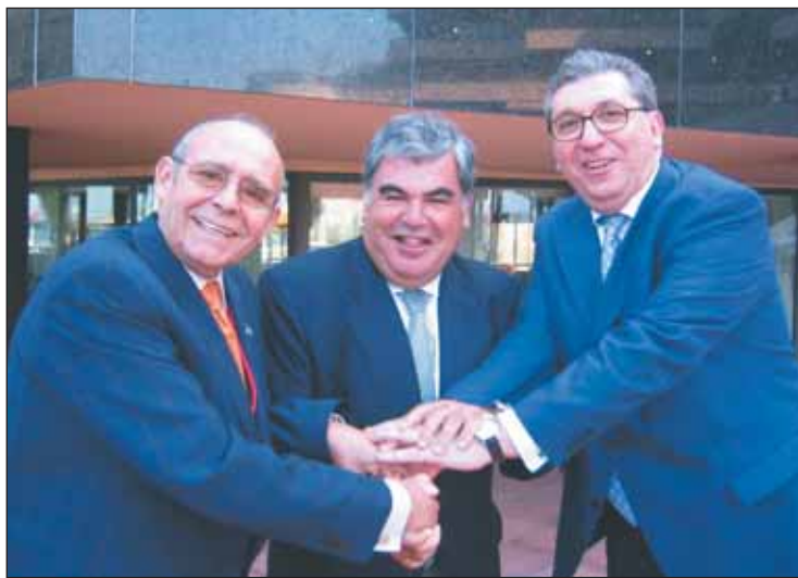
Un apretón de manos, símbolo de la colaboración de las tres asociaciones profesionales.

De hecho, actualmente ya se están dando pasos en la colaboración, tal como prueba la presencia de OPC España en el congreso de la AFE y la presencia de la Asociación de Palacios de Congresos (AEPC) en la próxima Reunión Nacional de OPC España, que tendrá lugar en La Coruña en próximo mes de febrero de