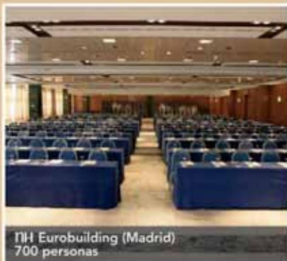
NH Eurobuilding (Madrid) 700 personas

El grupo empresarial Impulsa amplía sus instalaciones y con este fin traslada su sede central a unas nuevas dependencias ubicadas en la calle Méjico número 19, de Madrid. El grupo integra actualmente dos sociedades: Impulsa Iniciativas y Medios, dedicada a la comunicación corporativa y la organización de eventos, e Impulsa Meeting & Business Travel, agencia de viajes especializada en los servicios turísticos orientados al turismo de negocios y reuniones.