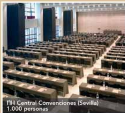
NH Central Convenciones (Sevilla) 1.000 personas